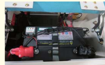
サブバッテリー走行充電システム インバーター1500W ※昇圧タイプ走行充電器使用（サブバッテリーへの入力電圧を上げ高効率充電） ※バッテリー保護のためのプロテクター標準装備