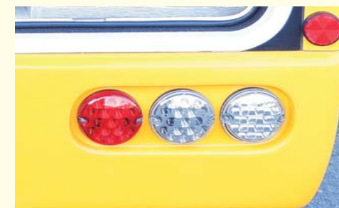
オシャレな3連LEDテールランプ