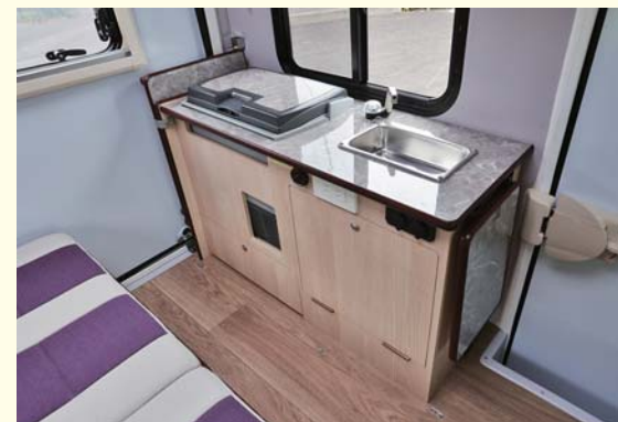
標準ギャレー 10L給排水ポリタンク、電動ポンプ付 ※冷蔵庫上部テーブル標準装備