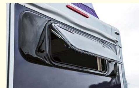
リア・アクリル プッシュアウト式ウィンドウ （網窓・シェード付き）