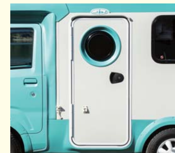
エントランスドア 可愛い元祖丸窓 ドアストッパーと雨どい付き