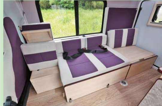
走行時 セカンドシート