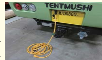
外部AC100V入力ソケット ※外部AC、インバーター電源 自動切替装置付 ※入力時 メイン・サブバッテリー自動充電器付