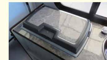
冷蔵庫 18L ※冷却可能温度+10℃～-18℃ ※上部テーブル付