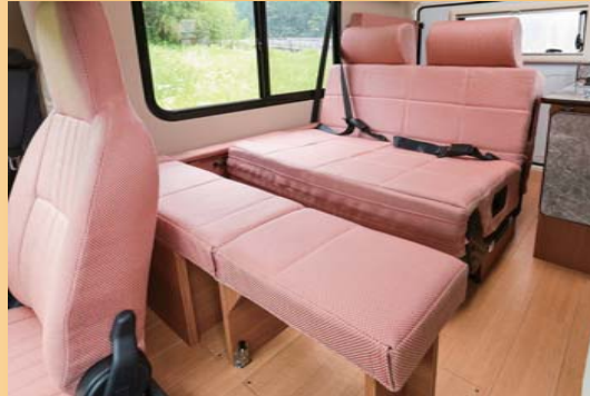
走行時 セカンドシート