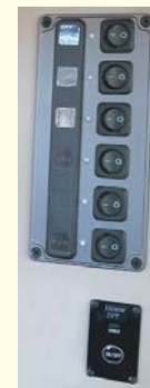
6連スイッチパネル & インバータースイッチ