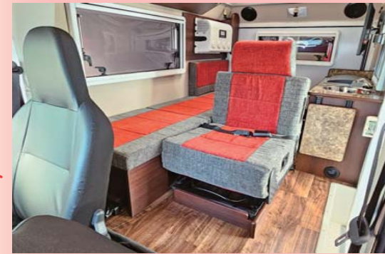
1人用前向きシート