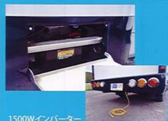
1500Wインバーター オートチャージャー・外部AC入力 サブバッテリー・走行充電システムを標準装備 （OPにて更にバッテリー1個増設可）