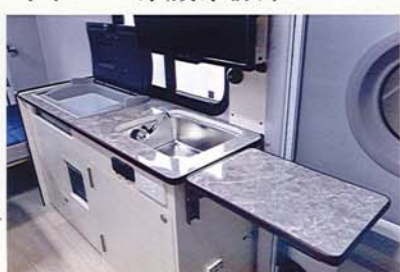
ギャレー給排水 各10ℓタンク 電動ポンプ式 シンク蓋仕様はOP